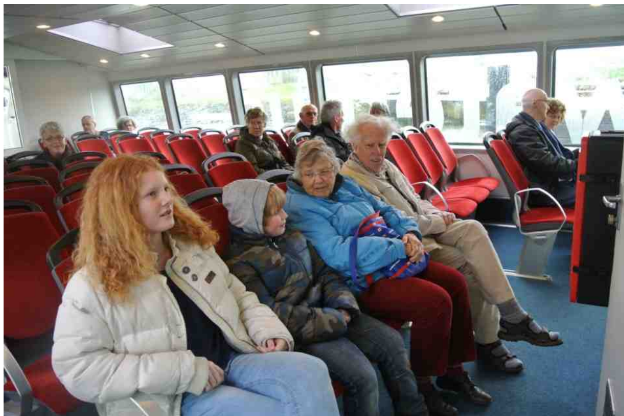
Zeeuwen in Dordrecht