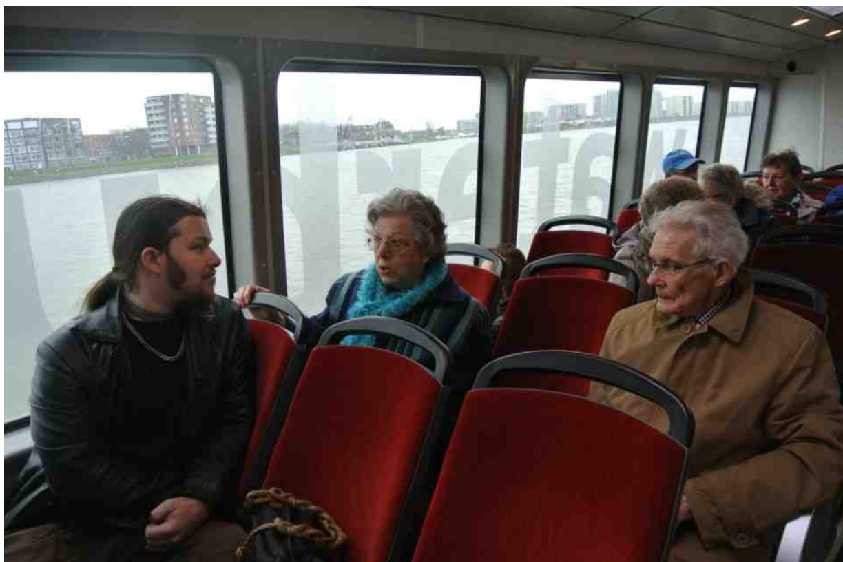
Gezellig in de waterbus